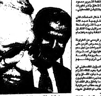
محادات بين محمود عباس والطرانة في عمان